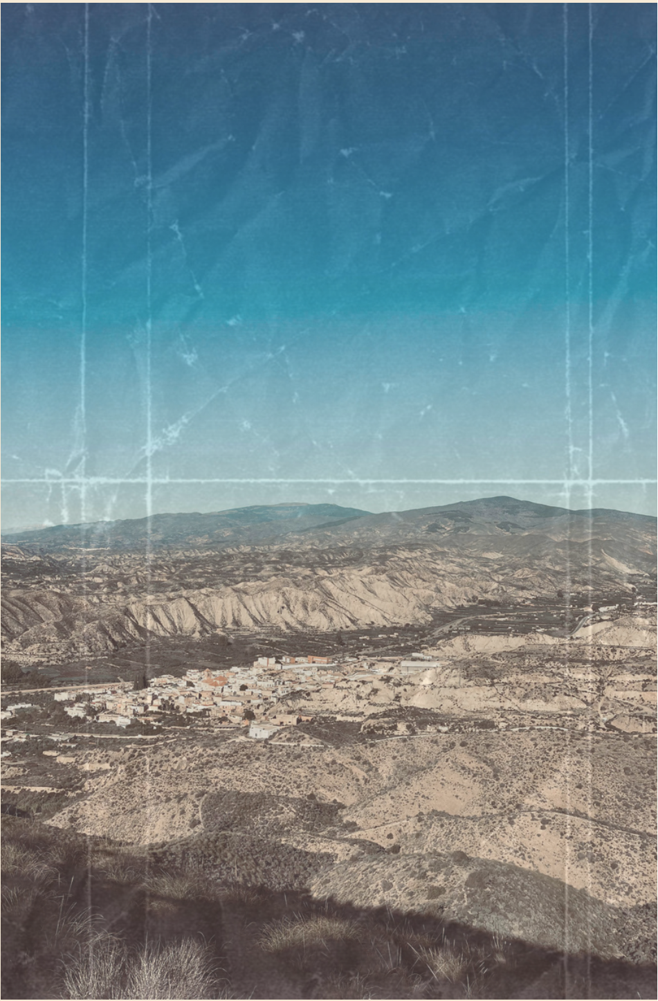
Vistas del pueblo de Alhabia